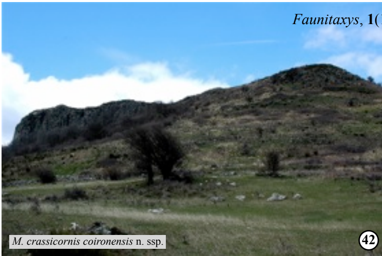
M. crassicornis coironensis n. ssp.